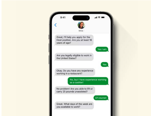
이미지: SMS 채팅으로 채용 분야에 지원하는 대화형 어플리케이션