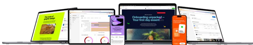
Workday Learning, optimisé par Sana, sur différents appareils

Workday Learning, optimisé par Sana, réunit ces fonctionnalités dans une plateforme unifiée basée sur des données Workday fiables. La formation devient un processus contextuel et personnalisé pour les collaborateurs, la création de contenu basée sur l'IA accélère la production de cours pour les équipes de contenu, et les opérations de formation se développent à grande échelle grâce à une gouvernance et une conformité intégrées.